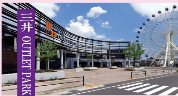
三井 OUTLET PARK

【仙台港三井 OUTLET PARK】位於宮城縣近郊，仙台市與松島之間，50 公尺高的諾大摩天輪是最好認的地標，三井 OUTLET 擁有 120 間店舖，大舉推出各種精品店免稅服務，知名品牌退稅不落人後。MOP 仙台港三井 OUTLET 裏有許多餐廳，各種東北經典美食如牛舌等都吃得到喔！