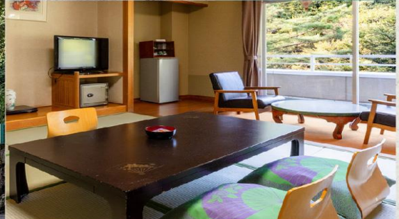
觀山飯店位於磐梯朝日國家公園內的裏磐梯地區，無論前往會津或磐梯高原、豬苗代周邊等區域觀光都極為便利。由飯店客房，便能欣賞到裏磐梯的四季自然美景。