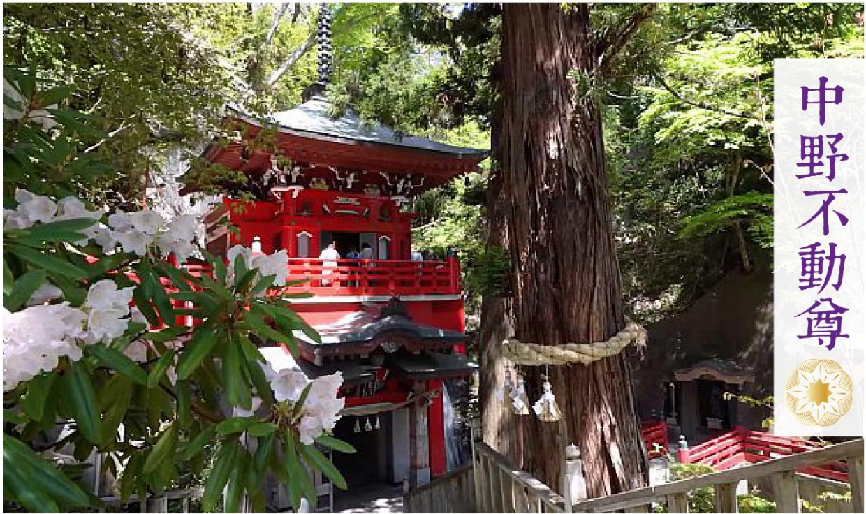
祀奉著不動明王「日本三大不動」之一的著名的中野不動尊，在當地被稱為是「中野的不動神明」。